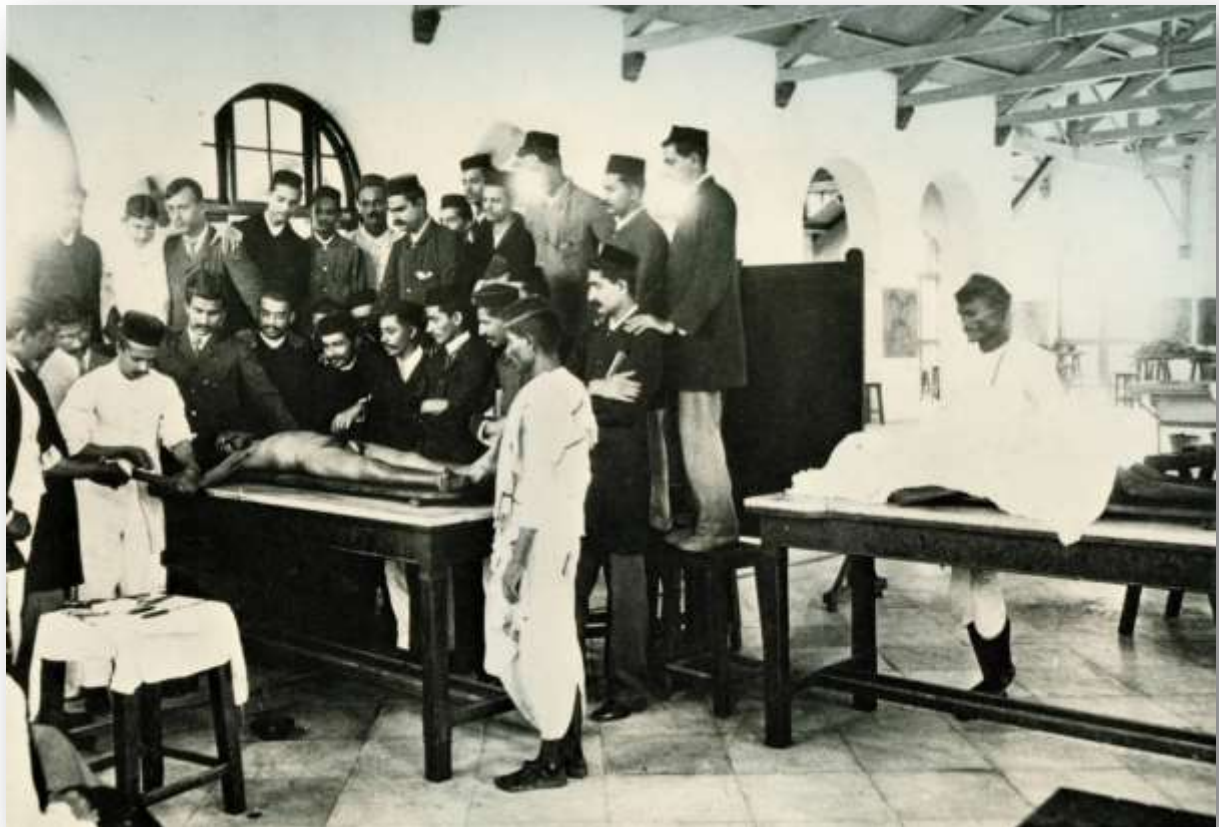
Indische Medizinstudenten bei einer Sektion im Grant Medical College, Bombay (1910)