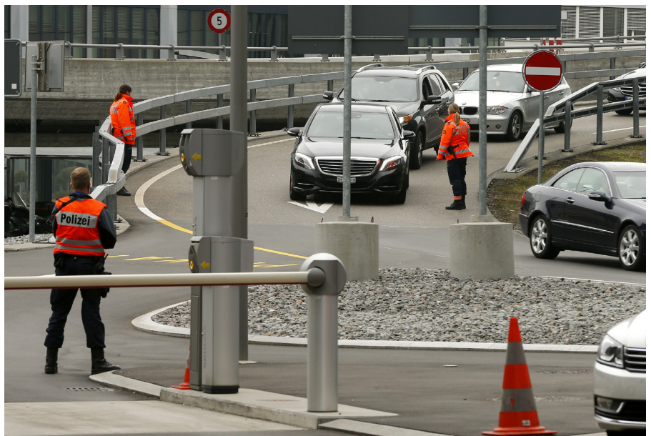
Kurz nach dem Anschlag am Brüsseler Flughafen im März 2016 wurden auch am Flughafen in Zürich Polizeipräsenz und Kontrollen vorübergehend verschärft.

Seit den Anschlägen steht die Frage nach einer besseren Absicherung von Flughäfen erneut im Raum und wird auch in der Schweiz diskutiert. Der Zürcher Flughafen als internationales Verkehrsdrehkreuz dient exemplarisch als Fallbeispiel für die Debatte.