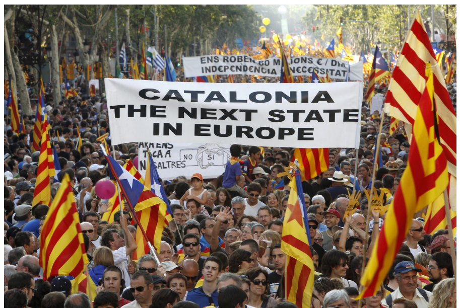
Demonstranten protestieren in Barcelona mit Transparenten und Fahnen für ein unabhängiges Katalonien innerhalb der EU.

Gerade in wirtschaftsstarken Regionen verstärkte die Wirtschaftskrise in Europa das Begehren nach mehr Autonomie. Unabhängigkeitsforderungen dienen in diesem Zusammenhang auch als Druckmittel gegenüber der Zentralregierung. Es ist nicht immer einfach zu erkennen, ob Be-