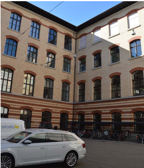
CAB Innenhof Nord