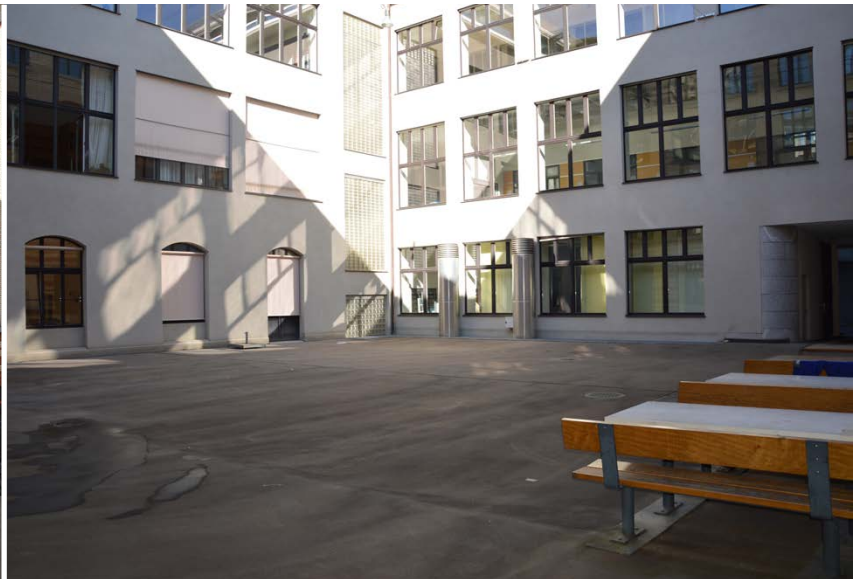
CAB Innenhof Süd

ETH Zürich Abteilung Campus Services Bewilligungen Binzmühlestrasse 130 8092 Zürich