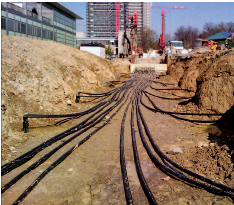
Beispielhaftes Konzept auf dem Campus Science City der ETH Zürich: Im Sommer wird die Abwärme der Gebäude über 800 Erdsonden im Boden zum Heizen im Winter gespeichert.

Forschung und Lehre sind wichtige Treiber für Innovationen in der Wirtschaft. Handkehrum tragen Hochschulen wie die ETH Zürich und andere Forschungsinstitutionen mit neusten Erkenntnissen selbst zur Lösung gesellschaftlicher Herausforderungen bei. Diese zweifache Aufgabe ist bei Energiefragen besonders weitsichtig zu erfüllen.